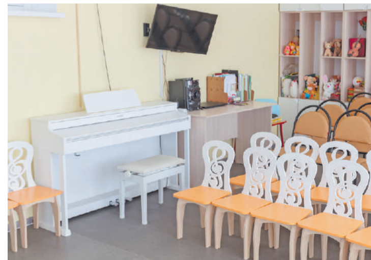
Детский сад «Зелёный огонёк» в Хотькове открылся после капитального ремонта в 2024 году

Анвар Гизатулин